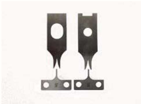
● クリンパー/アンビル