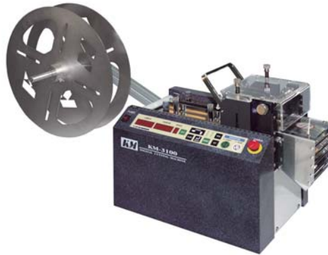
KM-3100/3200/3300/3400 チューブカッター