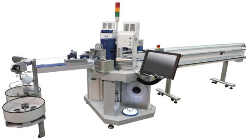
Lims-A1 全自動両端圧着機