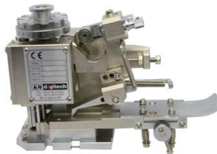
● KM-902C(E) エンドフィードタイプ

KM digitech JAPAN株式会社 171-0022 東京都豊島区南池袋2-12-1 佐伯池袋ビル207 TEL & FAX : 03-5376-6672