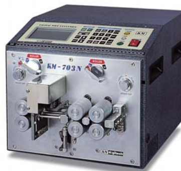
KM-702N/703N 自動電線測長・切断・ストリップ機