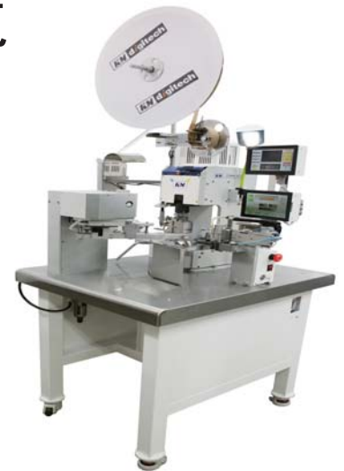
Lims-SS1 防水シール挿入・ストリップ クリンパー