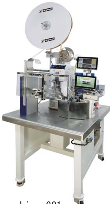
Lims-SC1 ストリップ クリンパー