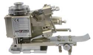
KM-902C エンドフィードアプリアケター