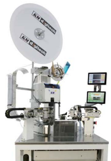
Lims-SW1 ダブルストリップ クリンパー