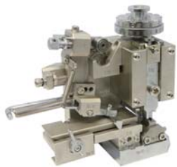
KM-901C サイドフィードアプリアケター